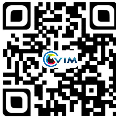
图 2 VIM 二维码