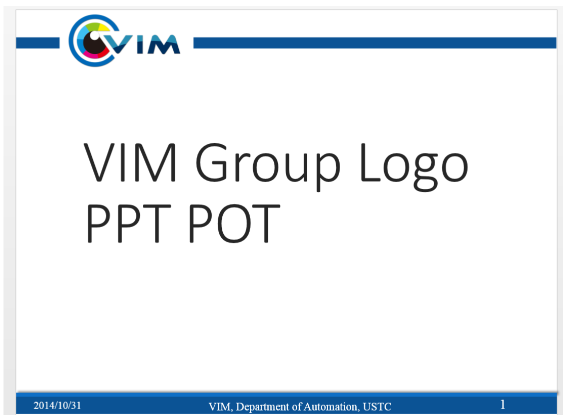
图 3 VIM Group Logo PPT 模板样例

至于平面 Logo 的使用，并没有什么固定的规则，因此不做过多说明，仅给出一个 PPT 的样例模板，同时，本 WORD 文档所使用的可以看做一个 DOC 的样例模板，欢迎 VIMer 们集思广益，在此款 Logo 上创造出更多更好的模板。